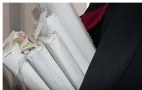
DELFI (D.Sinkevičiaus nuotr.)