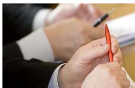
DELFI (K.Čachovskio nuotr.)

Šią savaitę Vilniuje įvyks 11-oji metinė Europos kriminologų draugijos konferencija „Permaštant nusikaltimus ir bausmes Europoje“, kurioje dalyvaus daugiau kaip 600 kriminologų iš Europos, taip pat ir iš kitų pasaulio valstybių.