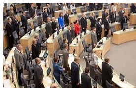
DELFI

Antradienį Seime pristatomos Prezidentės Dalios Grybauskaitės iniciatyva parengtos Administracinių bylų teisenos ir Konstitucinio Teismo įstatymų pataisos, kuriomis siekiama paspartinti bylų nagrinėjimą, padaryti teisminį procesą greitesnį, ekonomiškesnį ir paprastesnį. Taip pat teikiamas siūlymas atsisakyti nelanksčios Aukščiausiojo Teismo teisėjų skaičiaus nustatymo tvarkos ir priimti nutarimą, kuriuo būtų sumažintas teisėjų skaičius Aukščiausiajame Teisme.