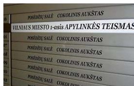
DELFI (D.Sinkevičiaus nuotr.)