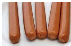
Prekybos centras į teismą padavė dėl 2 centų (1)

Nerimas dėl Graikijos prisilėgę JAV akcijų rinką