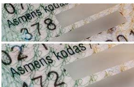
DELFI (V.Kopūsto nuotr.)

Žmogaus teisių stebėjimo institutas (ŽTSI) siūlo keisti asmens kodo struktūrą, juose atsisakant duomenų apie asmens lytį atskleidimo. Pasak instituto teisininkų, asmens kode atskleidžiama informacija apie lytį kelia ypatingų sunkumų transseksualams ir lemia jų teisės į privatumą pažeidimus.