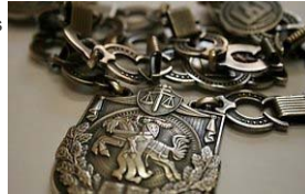
DELFI (D.Sinkevičiaus nuotr.)