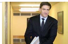
D. Kreivys. Aš gerbiu teismo sprendimą (30)

Taigi, vadovaujantis aukščiau nurodytais teisės aktais bet kuris žmogus, net ir nelaukiantis savęs įžymybė, gali kreiptis į teismą ir reikalauti, kad kitas asmuo nenaudotų jo pavardės domeno varde.