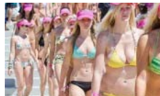
Parade Australijoje - 357 bikičius devynios moterys